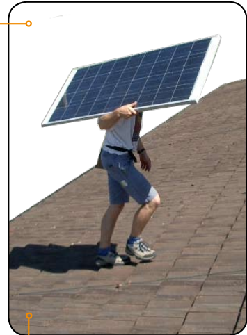
Montage und Beratung

Lassen Sie sich zu den Möglichkeiten zur Finanzierung, zur Systemdimensionierung und zur Montage kompetent beraten. Auf Wunsch werden die Solarkomponenten auf Ihre Verhältnisse abgestimmt. Verlangen Sie dazu eine unverbindliche Offerte.